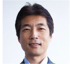
RGF HR Agent