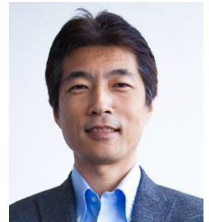
RGF HR Agent