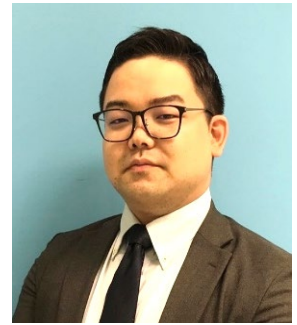
カンントリー マネージャー

【転職事例】コーポレートスタッフ（日本人材）／日系・製造業界／30代後半／約430万円（年収）