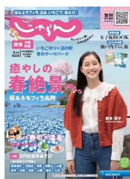
<関西・中国・四国版>