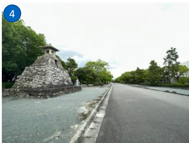
① 「箱崎駅」周辺 ② 「筥崎宮」 ③ 「Fukuoka Smart East」 ④ 「筥崎宮参道」