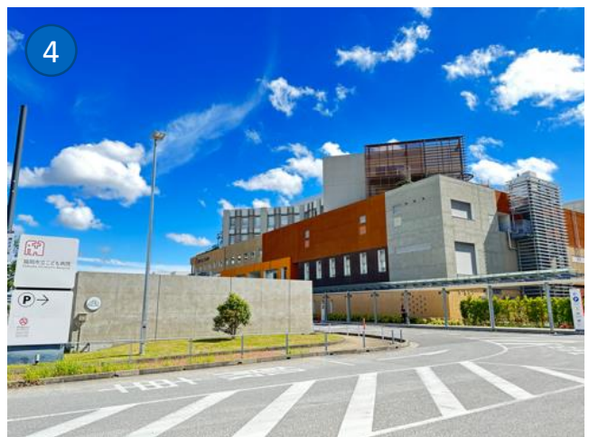
① 「JR香椎駅」周辺 ② 「千早駅」周辺 ③ 「アイランドシティ中央公園」から見えるマンション群 ④ 「アイランドシティ」内にある病院