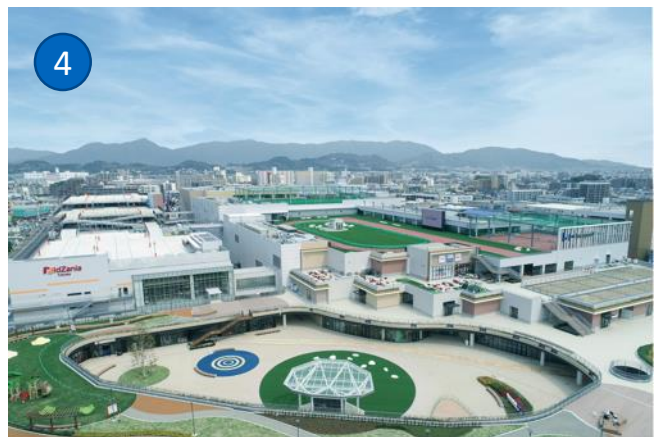
①「大橋駅」周辺 ②駅中にある「レイリア大橋」③「九州大学大橋キャンパス」④「三井ショッピングパーク ららぽーと福岡」