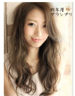
▲2014年度の1番人気は、肩の力が抜けたリラックスイーブ（363票）

12月4日（木）から投票を開始し、ここで選ばれた栄えある上位10作品は2015年1月末にWEB『ホットペッパービューティー』と情報誌『HOT PEPPER Beauty（2月号）』で発表し、2015年春のトレンドスタイルとして発信していきます。