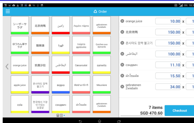
▲メニューは各国の言語で表記でき、レシートもその言語で印字されます