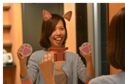
▲にゃらんに変身できるミラー

【本件に関するお問い合わせ先】 https://www.recruit-lifestyle.co.jp/support/press/