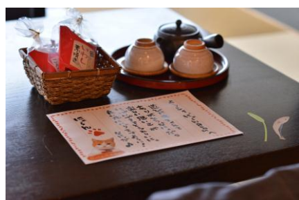
▲にゃらんからのお手紙でお出迎え