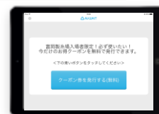
▲クーポンと発券画面イメージ