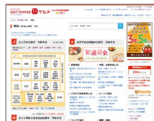
(上) 『ホットペッパーグルメ』サイト画面