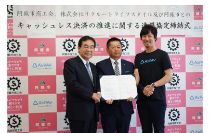
▲阿蘇市で2019年3月26日に行われた調印式の様子

『Airペイ』はこれまでも、多くの中小・小規模店舗に加え、熊本県阿蘇市との包括連携協定や山梨県富士吉田市、石川県加賀市山代温泉通り商店街、岩手県宮古市魚菜市场など、全国の地方自治体や商工会議所と連携して、キャッシュレス推進を牽引してまいりました。導入した店舗からは、「操作がカンタンで入ったばかりのアルバイトでも使えた」「訪日外国人集客により売上が上がった」などの声をいただいております。