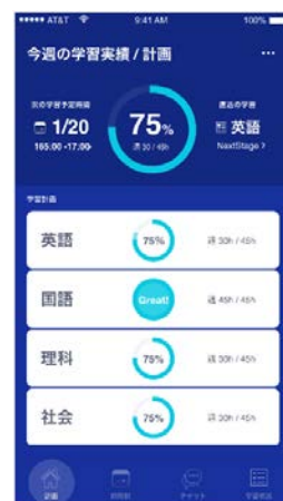
▲専用の学習管理アプリを開発 1ヶ月間、徹底伴走を行います