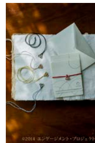
ストラップ付きメッセージカード「mus.hi-mo」

※2014年11月14日時点。順次拡大してまいりますので、詳細はサイトをご確認ください。