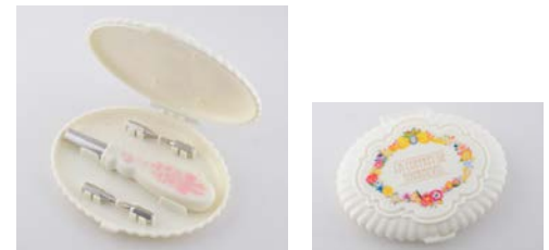
乙女すぎる♥ドライバーセット