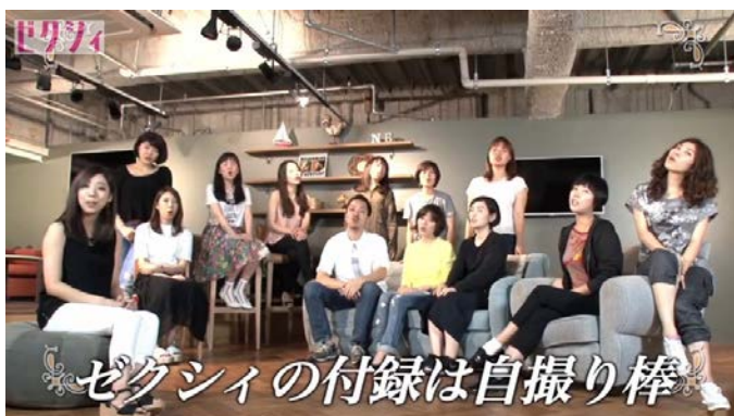
▲公式HPでは『ゼクシィ』編集部が実演する自撮り棒のトリセツを動画紹介