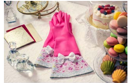
ベルばらすぎる♥花嫁専用ゴム手袋