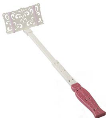
▲「シアワセすぎる♥花嫁専用 自撮り棒」

『ゼクシィ』では、花嫁の新生活を可愛くハッピーに彩るグッズ「〇〇すぎる」付録シリーズを発表しており、その斬新な内容（詳細は次頁ご参照）から毎回SNSなどで大きな反響を呼んでいます。今回は、花嫁にシアワセすぎる結婚式の思い出を残してもらう、とっておきのグッズをお届けします。