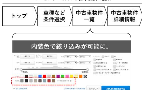
カーセンサーnetの中古車検索の流れ

リクルートテクノロジーズのビッグデータ部が提供する機械学習ソリューション群「A3RT（アート）」内のAPIサービス「Image Paradise（イメージパラダイス）」の取組みの一環として、リクルートマーケティングパートナーズが運営する中古車情報サイト「カーセンサーnet」において新機能「車の内装色」による絞り込み検索をローンチしました。これにより、サイト内では、利用者が好みの内装色を用いて中古車物件情報を絞り込むことが可能になりました。