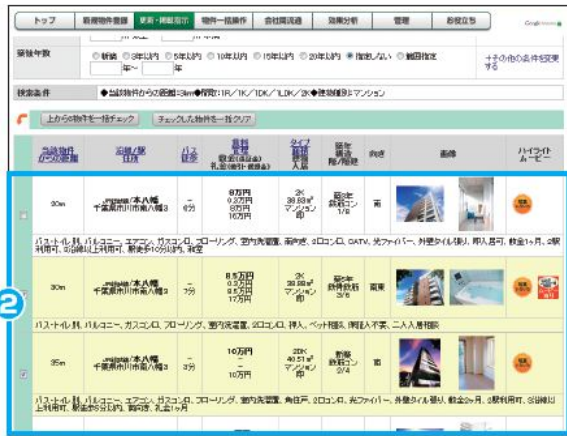
周辺物件選定画面