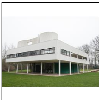
海外取材のひとつコマ (ル・コルビュジエの 『サヴォワ邸』)