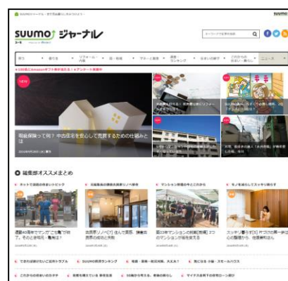
▲ 「SUUMOジャーナル」PC版ホームページトップ画面

また、皆様の住まい探しをよりスムーズに楽しくするために、PCサイトだけでなく、スマートフォンアプリ、ケータイサイトやフリーペーパー、市販誌、直接お会いして住まい探しのお手伝いをする相談カウンターでも皆様をサポートしています。