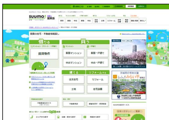
▲ 「SUUMO」PC版ホームページトップ画面