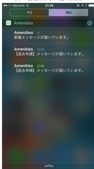
例、居住者向け通知画面