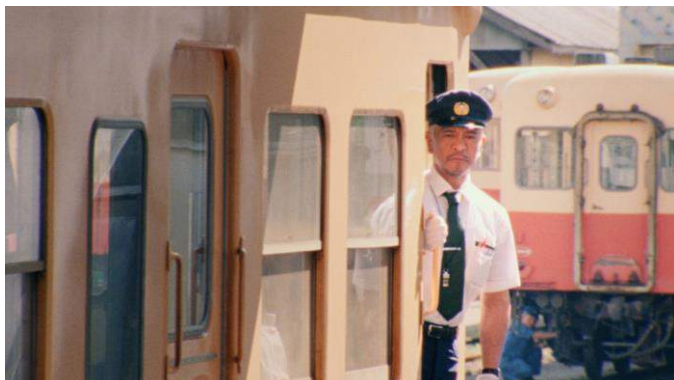
▲「ホーム」編：電車から体を乗り出し、ホームへアナウンスする松本さん。

“もし、あなたの日常に突然松本人志が現れたら……”をテーマに、松本さんが様々な場所で、様々な役をシュールに演じる『タウンワーク』の新CMシリーズ。2015年7月にスタートし、早くも続編が完成。今回もその神出鬼没ぶりに思わずクスリとしてしまうこと間違いなしの作品となっています。