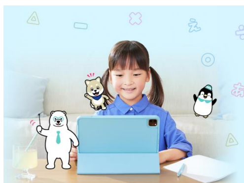
利用イメージ画像